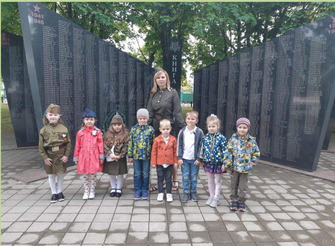
Книга памяти –здесь записаны имена ветеранов ,защищавших нашу Родину.