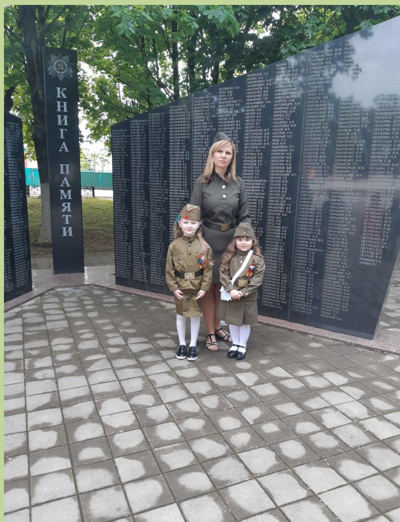
Дети прослушали интересную беседу о подвигах советских солдат нашей малой родины.